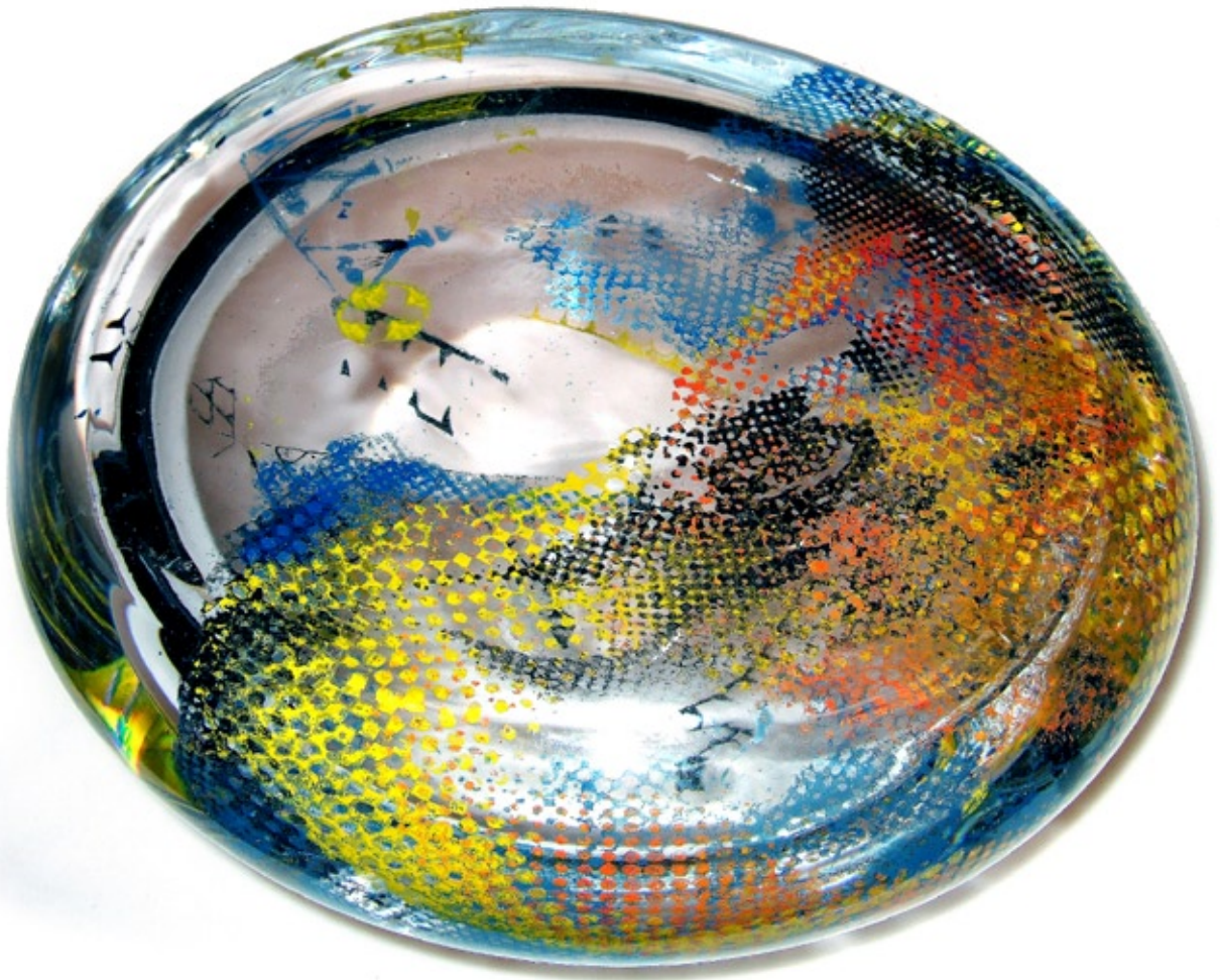
"Förnimmelse" Gral glas 30 x 30 x 28 cm © Tomas Colbengtson 2009