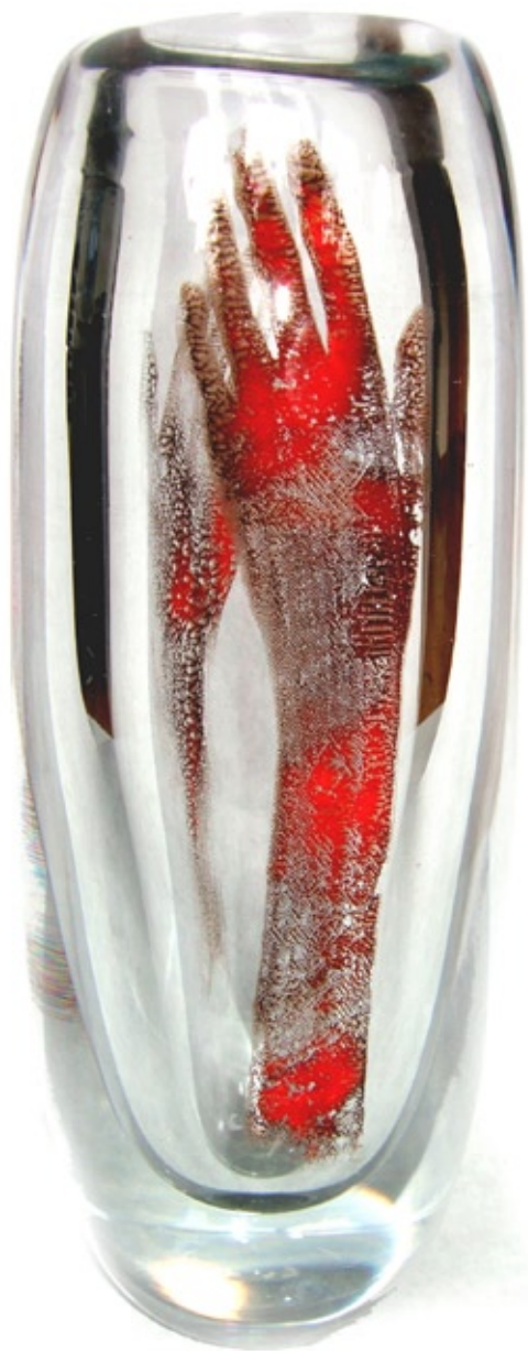
"Mötet" Gral glas 33 x 14 x 14 cm © Tomas Colbengtson 2008