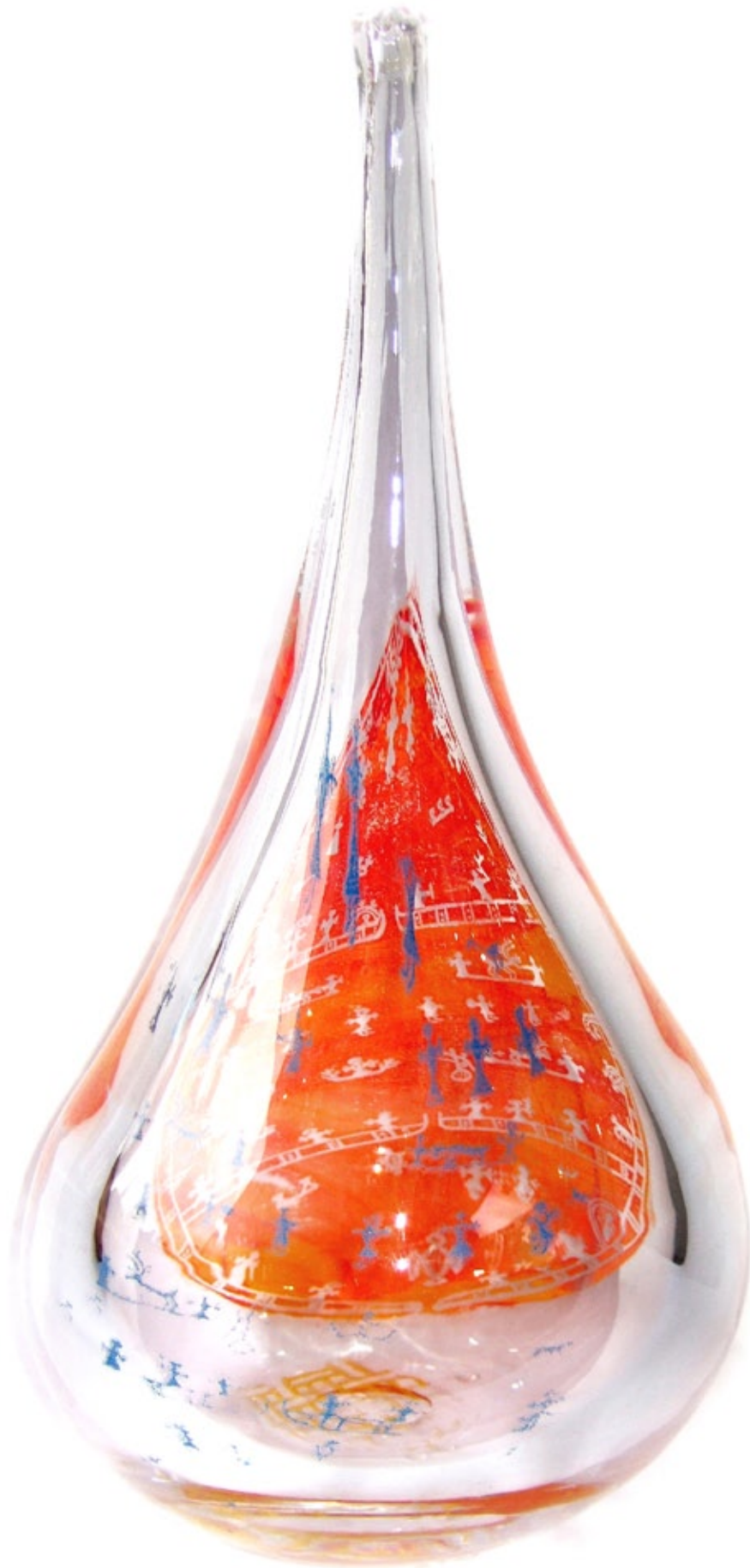
"Grievie" Gral glas 38 x 20 x 20 cm © Tomas Colbengtson 2008